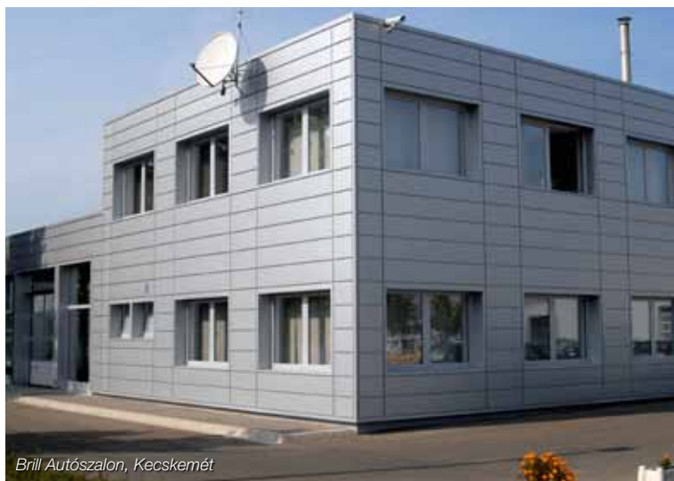
Brill Autószalon, Kecskemét

A kazettákkal azonos színű rögzítő csavarokból és különböző takaró szegélylemezekből álló teljes tartozékrendszer könnyedén és hatékonyan biztosítja az elegáns és tartós felületképzést. A nyílászárók vonalvezetése és a sarkok kiképzése is az elegáns homlokzati megjelenését biztosítja.