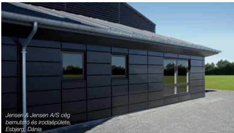
Jensen & Jensen A/S cég bemutató és irodaépülete, Esbjerg, Dánia

Az acél falkazetták külső felületére különböző fajtájú és színű bevonatok kerülnek. Az ECO falkazetták a standard 25µm vastag poliészter bevonattal 5 féle kedvelt színben (fehér, ezüst, sötétkék, sötétszürke, bézs) állnak rendelkezésre. Az új fejlesztésű PREMIUM falkazetták kétféle bevonattal készülnek: a 20µm PVDF bevonatot 4 alapszínben (fehér, fekete, ezüst, antracit metál); míg a speciális porszórásos technológiával felvitt fedőfestéket bármilyen RAL/NCS színkóddal megadva biztosítani tudjuk.