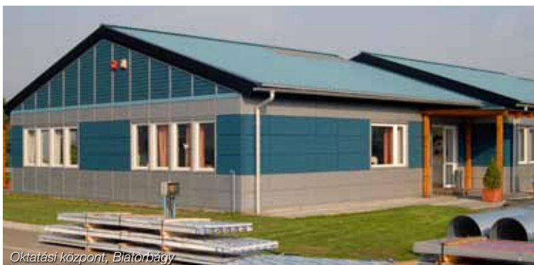
Oktatási központ, Blătorbágy

A cég teljes működése az ISO 14001-es környezetvédelmi tanúsítási rendszer alapján működik. Az alkalmazott alapanyagok újrahasznosíthatók, a termékek előállításához szükséges tevékenységek nem szennyezik a környezetet.