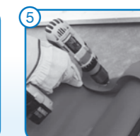
5 Az első Lindab LPA Scandic tábla felrakása és rögzítése (alul beakasztás, felül rögzítőfülek lecsavarozása)