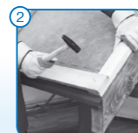
2 Ellenlécek (min. 4cm magas) és tetőlécek (10x2,5cm) elhelyezése