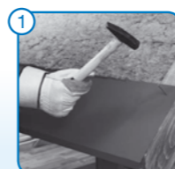
1 Alsó vízcsappentő ereszegély rögzítése a tetőszerkezethez

A Scandic cserepeslemez legnagyobb különbsége a többi táblás cserepeslemeztípustól eltérő, rejtett csavarozású rögzítéstechnológiában rejlik.