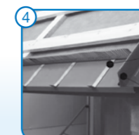
4 Indító profilok rögzítése, szellőzőfésű és oromoldali tömítőprofil elhelyezése