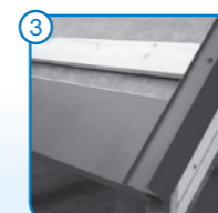
3 Felső ereszegély és oromszegély elhelyezése